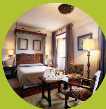
PARADOR DE SANTIAGO