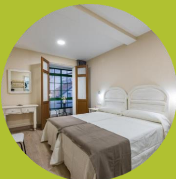
PENSIONES / HOSTALES